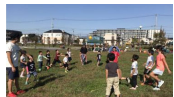
2018年10月に開催したBBQ大会の様子