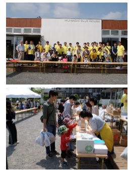
昨年の美化運動の様様

ご興味のある方は下記の受付方法で、「育まち自治会」までご連絡ください。担当者から連絡させていただきます。